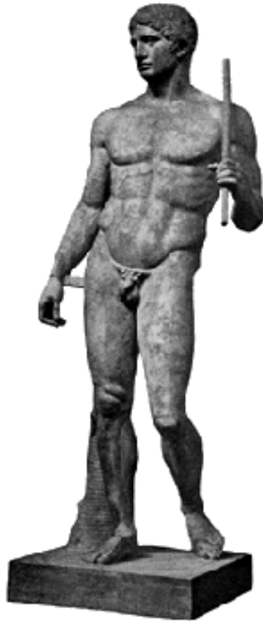
De Dorufooros van Polukleitos