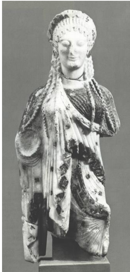
Kore 530 polychroom

Laat Archaisch: het lichaam is door de plooiwal heen te zien, de archaische glimlach gaat verdwijnen; het haar ligt in strengen over de schouder.