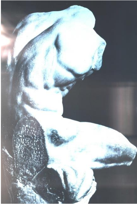
Hoofd van Sperlonga 150