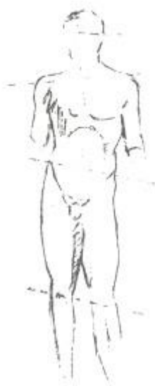
Omphalos Apollo (kopie) 460/4 heup en schouder draaien tegen elkaar in (contrapost)

Vroege beelden van de strengestijl kunnen veelal goed gedateerd worden omdat de beelden, die door de Perzen in 480 verwoest zijn op de Akropolis in een kuil bij het Parthenon gegooid zijn. Deze beelden hebben vaak nog archaische trekjes naast trekken van de strengestijl.