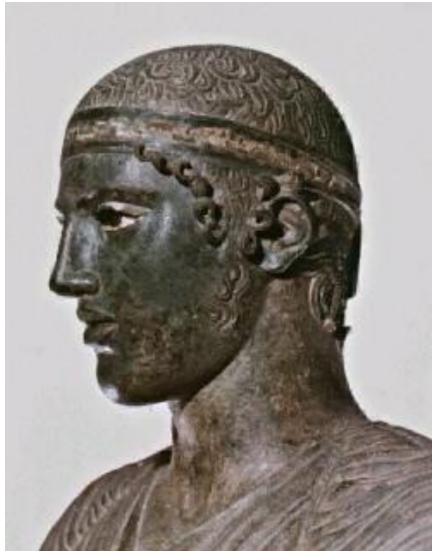
Wagenmänner van Delphi 480 Kritiasboy 480