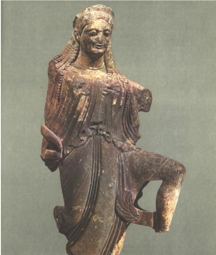
Stele Aristion 510