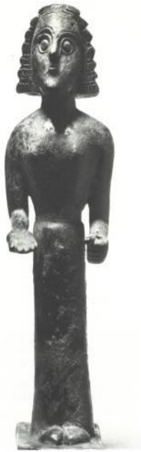
Bronzen kore 650