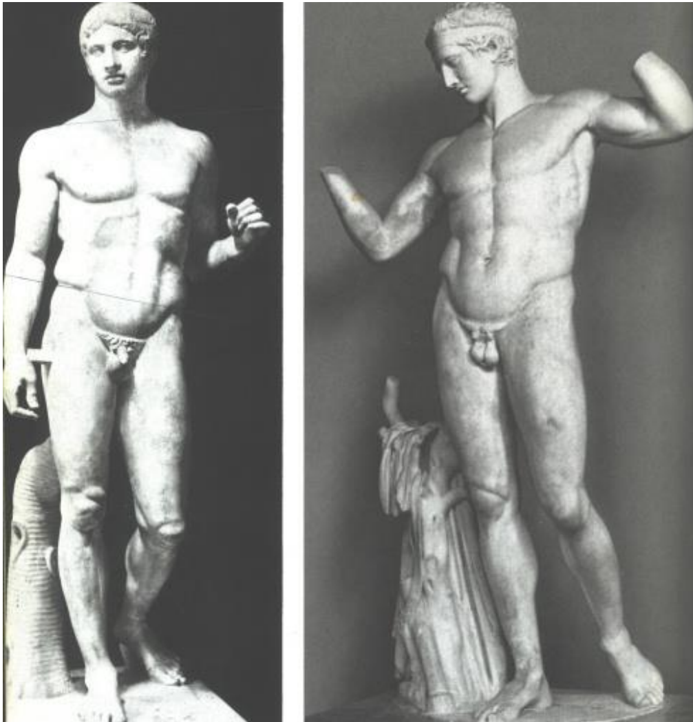
Doryphoros en Diadoumenos van Polykleitos 440