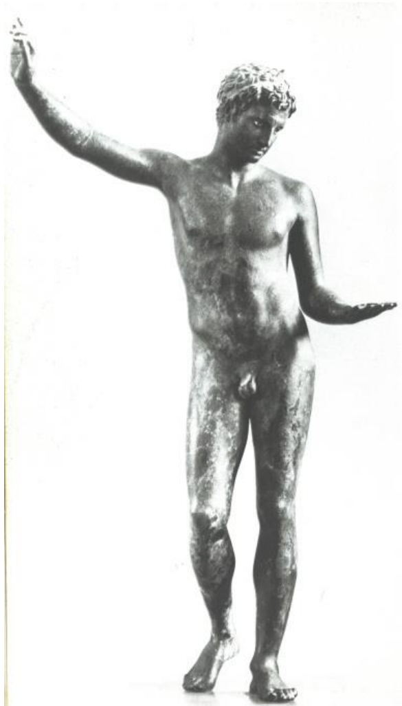
Apollo Sauroktonos Praxiteles 350 brons 320