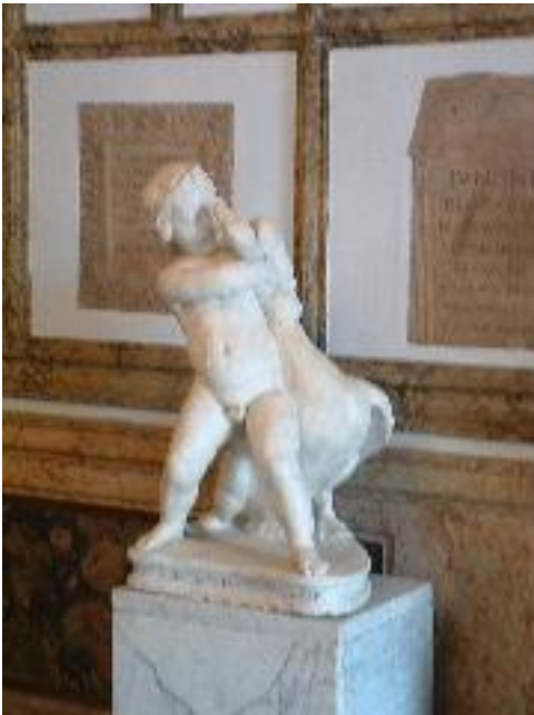
Jongen met gans 200