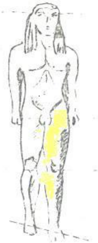
Biton 600/500 alle assen recht