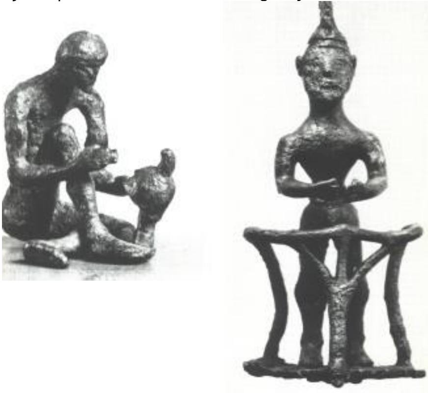
helmmaker en wagenmenner uit de 8 e eeuw

Deze beeldjes zijn moeilijk te dateren. Daarvoor moet men weten, waarvandaan ze komen en uit welke ateliers. Die kennis gaat voor ons te ver. Bekend is wel, dat men vanaf 725 begon met het vervaardigen van groepen figuurtjes, terwijl tot die tijd er sprake is van alleenstaande figuurtjes.