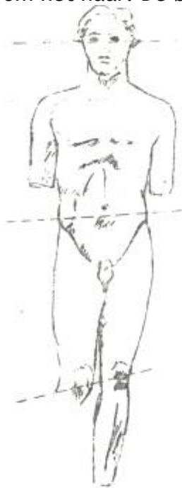
Kritios knaap 490/480 standbeen heup hoger

De Strengestijl 500- 450: de plooien worden eenvoudig maar wel zwaar (waaierplooien om een hoog punt aan te geven en oogjesplooien om een opeenhoping van stof weer te geven); de ogen krijgen dikke randen, zware kin en volle mond, de glimlach is weg; de anatomie is juist en de haren liggen in strengen over de schouders. De volumes gaan rustig in elkaar over en zijn niet meer door ornamentale lijnen begrensd. De beelden krijgen emotie. Ze worden soms in beweging afgebeeld, knielend, zittend, of liggend. De beweging blijft beperkt tot de armen benen, die zich buiten het blok van de torso bewegen. Vanaf 500 is de heup boven de naar voren bewogen knie gezakt, maar de schouders zijn nog horizontaal. De mannen hebben meestal kort haar. Goden hebben vaak een kapsel met daaromheen een vlecht en vrouwen hebben vaak een lange zware sluier om het haar. De beelden zijn zeer realistisch.