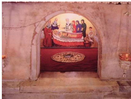
Nicolaus'graf in Bari

gebogen hoofd zag hij de engelen tot zich komen en na de psalm gezegd te hebben: "In u, heer, heb ik continu gehoopt, in uw handen etc." overhandigde hij zijn ziel in het jaar van de heer 343, toen muziek van hemelingen gehoord was. Toen hij in een marmoreen tombe begraven was, stroomde een bron olie vanuit zijn hoofd en vanuit zijn voeten een bron water en helemaal tot vandaag welt uit zijn leden heilige olie, die kracht heeft voor het heil van velen. Maar in zijn plaats is een zeker goed man gekomen, die evenwel van zijn plaats door jaloersen is verdreven. En toen hij verdreven was hield de olie op te stromen, maar toen hij teruggeroepen was weldde de olie onmiddellijk weer op.