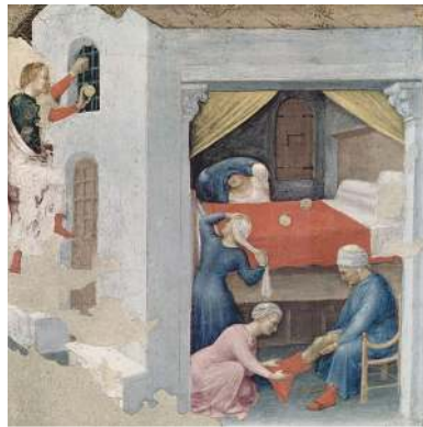
Sint Nicolaas gooit drie goudklompen in de kamer van de meisjes, ca. 1425

en wierp hij in de nacht heimelijk een klomp goud in een lap gewikkeld in diens huis door het raam en ging hij stiekem weg. Toen echter de man in de ochtend opstond vond hij de klomp goud en God dankend vierde hij het huwelijk van zijn eerstgeboren dochter. Korte tijd daarna deed de dienaar Gods een zelfde daad. En toen die vader dit weer ontdekte en zelfs grenzeloze lofprijzingen uitte, stelde hij voor voortaan wakker te blijven, om te weten, wie het was, die zijn armoede te