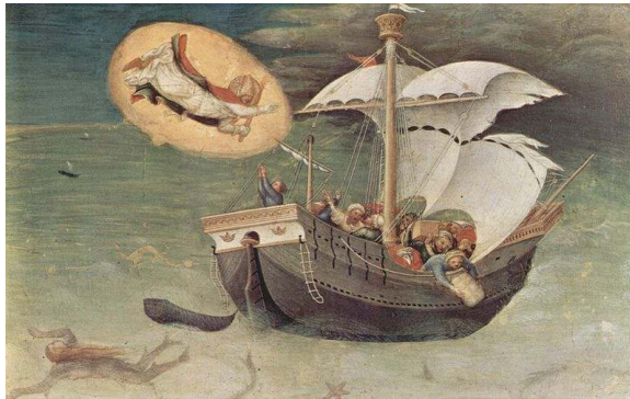
Gentile da Fabriano 1425

En hij begon hen in de ra's en touwen en ander scheeps-