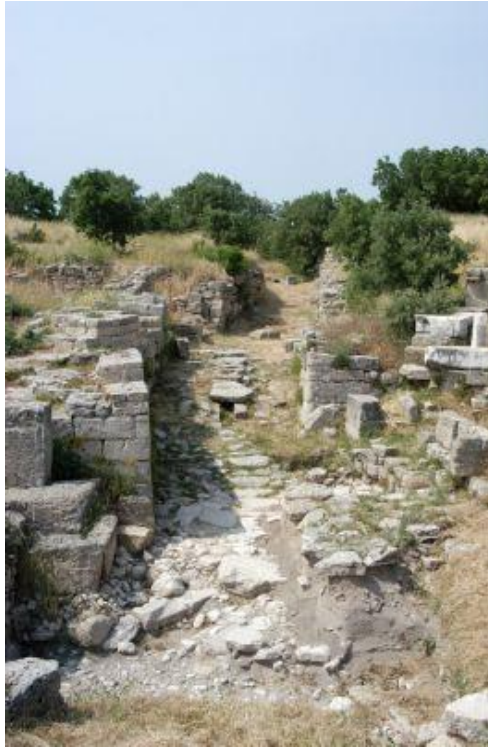
de resten van Troje