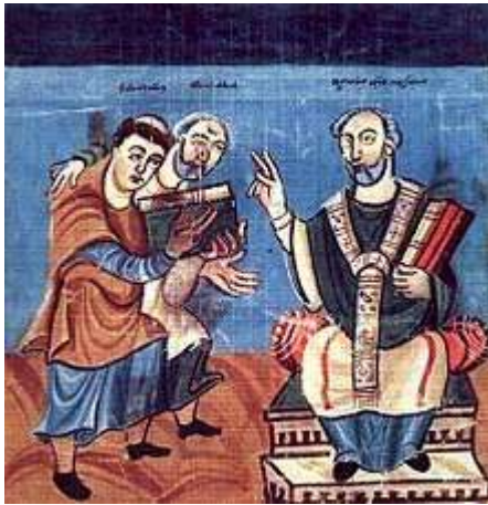
Alcuin van York

hem naar de voornoemde leermeester van de burgerij der Angelen York gestuurd en ze gaven hem daarbij wat hij nodig had op zijn reis. Hem heeft de beroemde leermeester Alcuin met grote vreugde opgenomen.