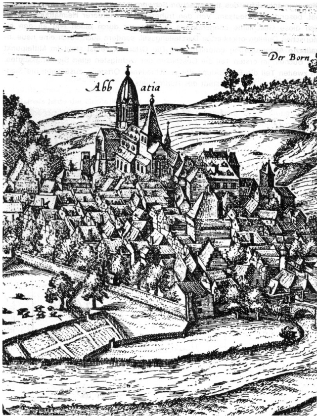
abdij Werden 1581