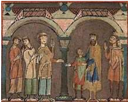
de Utrechtse cathedraalschool

Toen hij hierna met grotere genade overladen was, vroeg hij zijn ouders om hem aan een man Gods toe te vertrouwen om hem te ontwikkelen. En omdat zij welwillend waren, roemden zij God, toen ze de intensiteit van de jongeman zagen en ze bevalen hem aan bij de eerbiedwaardige Gregorius, leerling en opvolger van de heilige Bonifatius de martelaar, om hem op te voeden voor de Heer. En hij heeft hem graag opgenomen en toen hij de