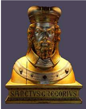
de heilige Gregorius

opgenomen en toen hij te weten was gekomen dat hij een goede en geleerde man was, ried hij hem aan voor hem bisschop op het platteland te worden. Niet immers was diezelfde Gregorius tot de rang van bisschop bevorderd, maar hij bleef in de rang van priester. De verstandige man Alubert dus zei hierop: "Opdat u weet dat ik met de toestemming en het beleid van mijn bisschop hierheen kom, moet u met mij trouwe broeders sturen naar het land waarvan ik gekomen ben naar mijn bisschop opdat het door hem mij bevolen wordt en ik hem ook op zo'n wijze instemming geef. Abt Gregorius hoorde dit graag en stuurde hem en met hem Ludger en nog een broeder sterker in leeftijd Sigibod genaamd naar de bisschop 10 , over wie Alubert gesproken had. 767. Hij benoemde Alubert tot bisschop, Sigibod tot priester en Ludger tot diaken en zij bleven daar één jaar. Alcuin was ook op die plaats 11 meester, Alcuin die later in de tijden van Karel de Jongere 12 in Tours en in Frankrijk onderwijs gaf. Aan hem werd onmiddellijk de verstandige Ludger zonder kwade bedoelingen toegevoegd om aan hem geestelijke geloofspunten te ontlenuen. Maar na een heel jaar keerden zij die gezonden waren terug en onder leiding van de Heer bereikten ze abt Gregorius, die hen welwillend ontving met grote vreugde bij hun aankomst en Alubert bleef bij hem terwijl hij zich met hem inzette in het werk van de Heer.